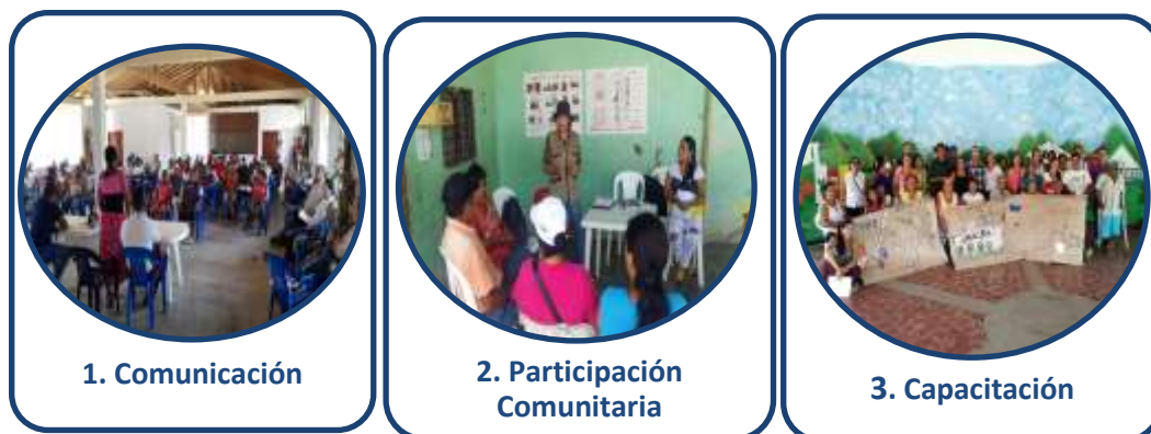
Figura 2. Líneas de intervención del Plan de Gestión Social.

A continuación, se presentan las líneas de intervención que componen el PGS, el cual deberá implementarse de manera articulada entre las entidades involucradas Municipio, Prestador de Servicios Públicos de Acueducto y Alcantarillado (Prestador), ejecutor del proyecto, según correspondan sus obligaciones, y Gestor del Plan Departamental de Agua - PDA en caso que aplique.