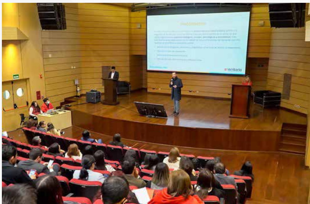
Foto: Presentación de la iniciativa por parte de ENTerritorio

Los datos de asistencia fueron recolectados por parte del Ministerio de Hacienda y Crédito Público. Sin embargo, se registraron más de 150 asistentes en vivo y alrededor de 70 presenciales, entre los que se destacan colaboradores de entidades del sector como Superfinanciera, Previsora, Fiduprevisora, Fiducoldex, Bancoldex y Positiva, y empresa privada como Pensemos S.A. Al corte 29 de noviembre de 2022 se registran 1.015 visitas post streaming.