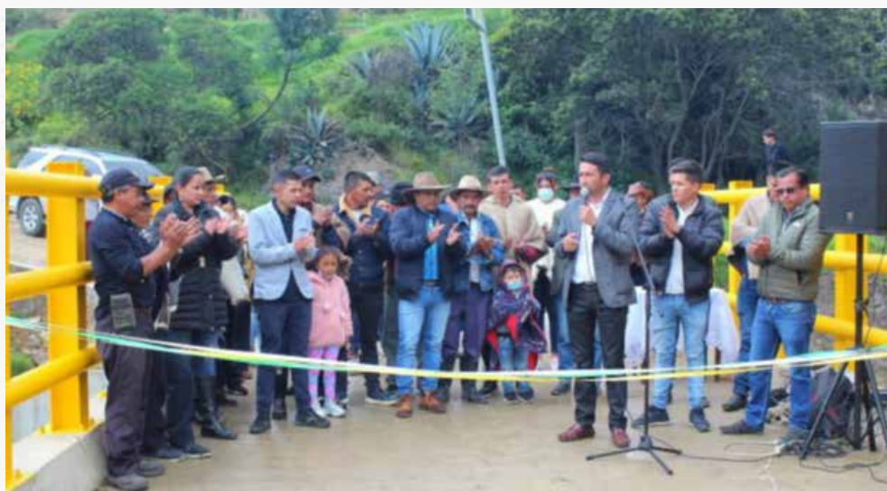
Foto: Comunidad y veeduría en la entrega del proyecto realizada el 22 de junio de 2022

Se puso a disposición en el mini sitio de rendición de cuentas el informe y registro fotográfico de la actividad realizada: https://www.enterritorio.gov.co/web/rendicion-de-cuentas/transformamos-vidas/espacios-de-dialogo/2022 .