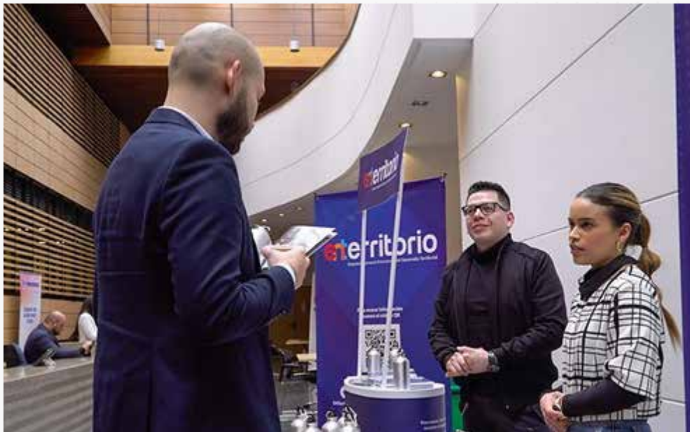
Foto: Feria de servicios - punto de atención itinerante

Así mismo, en este punto de atención itinerante se brindó información acerca de los principales canales de atención de ENTerritorio y sobre la gestión de PQRSDF.