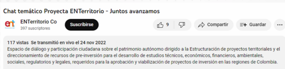
Foto: Registro de visitas post streaming del chat temático

Todos los pormenores y registro fotográfico están contenidos en el siguiente enlace: https://www.enterritorio.gov.co/web/rendicion-de-cuentas/transformamos-vidas/espacios-de-dialogo/2022