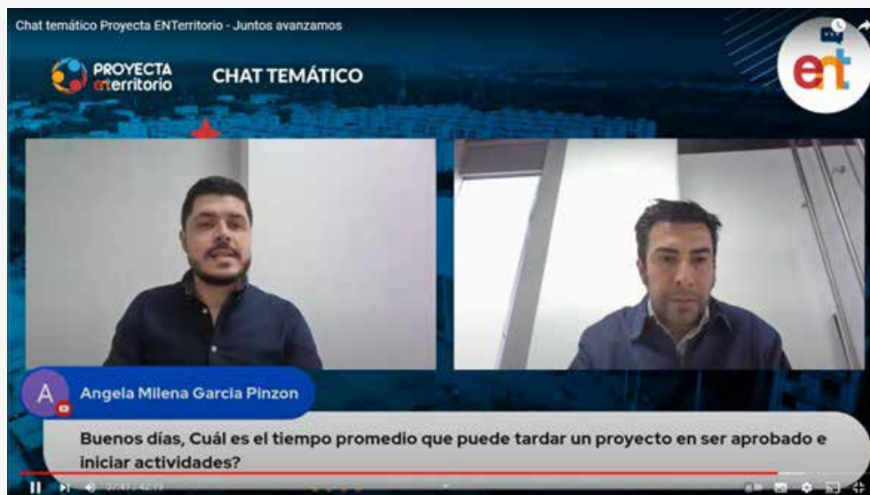
Foto: Espacio de interacción ciudadana – respuestas a las inquietudes registradas

Todos los pormenores y registro fotográfico están contenidos en el siguiente enlace: https://www.enterritorio.gov.co/web/rendicion-de-cuentas/transformamos-vidas/espacios-de-dialogo/2022