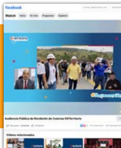
Página oficial de Facebook