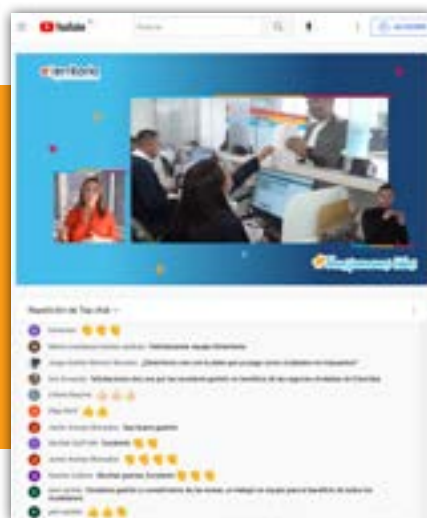
Canal de YouTube