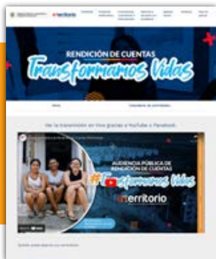
Mini sitio de Rendición de Cuentas. Portal web institucional

La Empresa Nacional Promotora del Desarrollo Territorial – ENTerritorio dentro de la obligación legal de Rendir Cuentas a la Ciudadanía llevó a cabo el evento la Audiencia Pública desarrollada el día 5 de agosto del 2022 en modalidad virtual, la cual fue transmitida a través de: