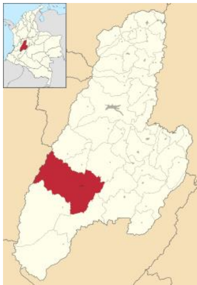
Ilustración 1: Localización del municipio de Chaparral, Tolima.

El proyecto se ejecutará sobre el RÍO AMOYA, vía a la vereda Mesa de Aguayo Corregimiento del Limón, Municipio de Chaparral departamento del Tolima.