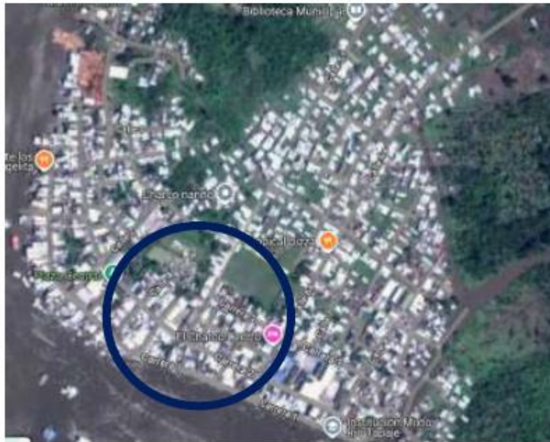
Imagen 1 – Localización de El Charco.