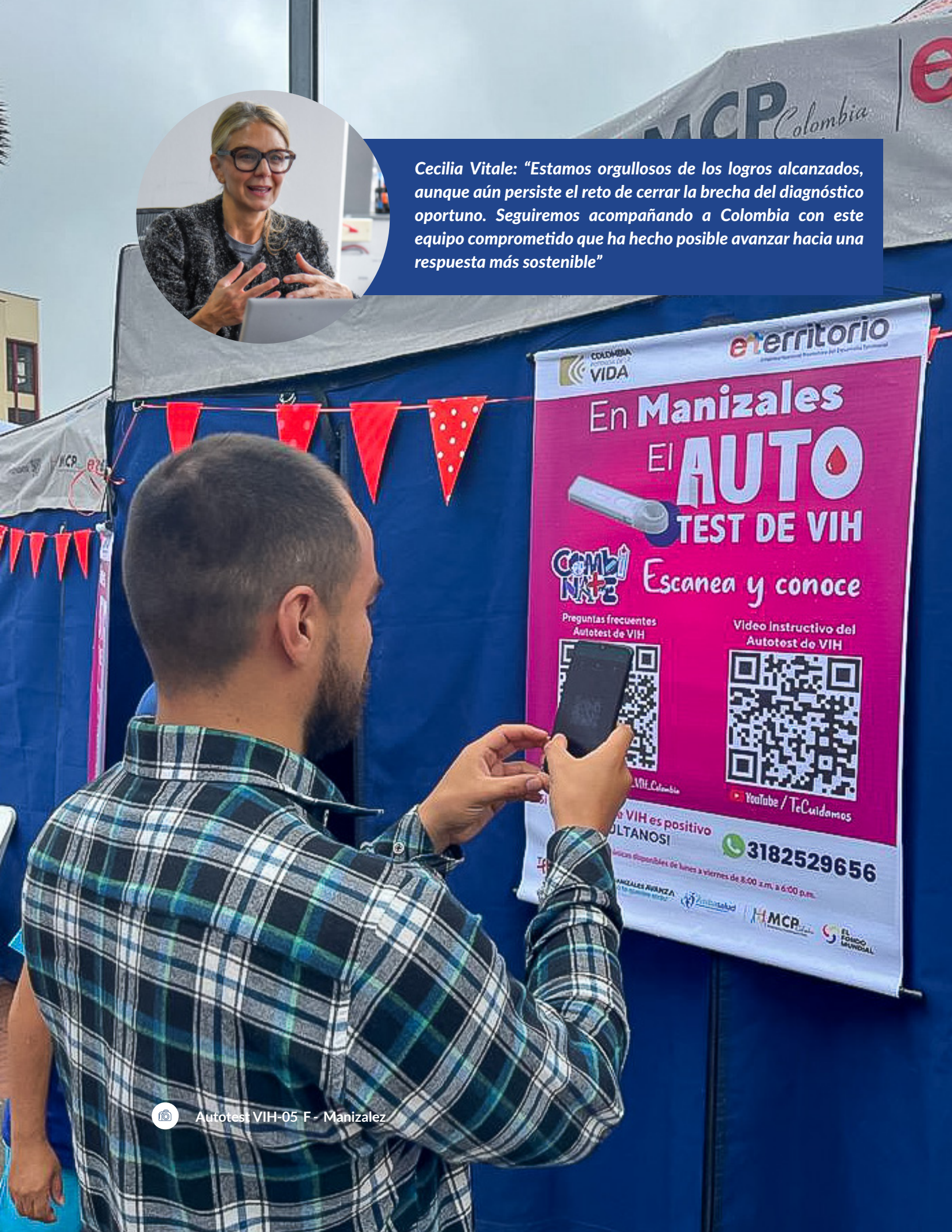
Autotest VIH-05 F - Manizales

Cecilia Vitale: “Estamos orgullosos de los logros alcanzados, aunque aún persiste el reto de cerrar la brecha del diagnóstico oportuno. Seguiremos acompañando a Colombia con este equipo comprometido que ha hecho posible avanzar hacia una respuesta más sostenible”