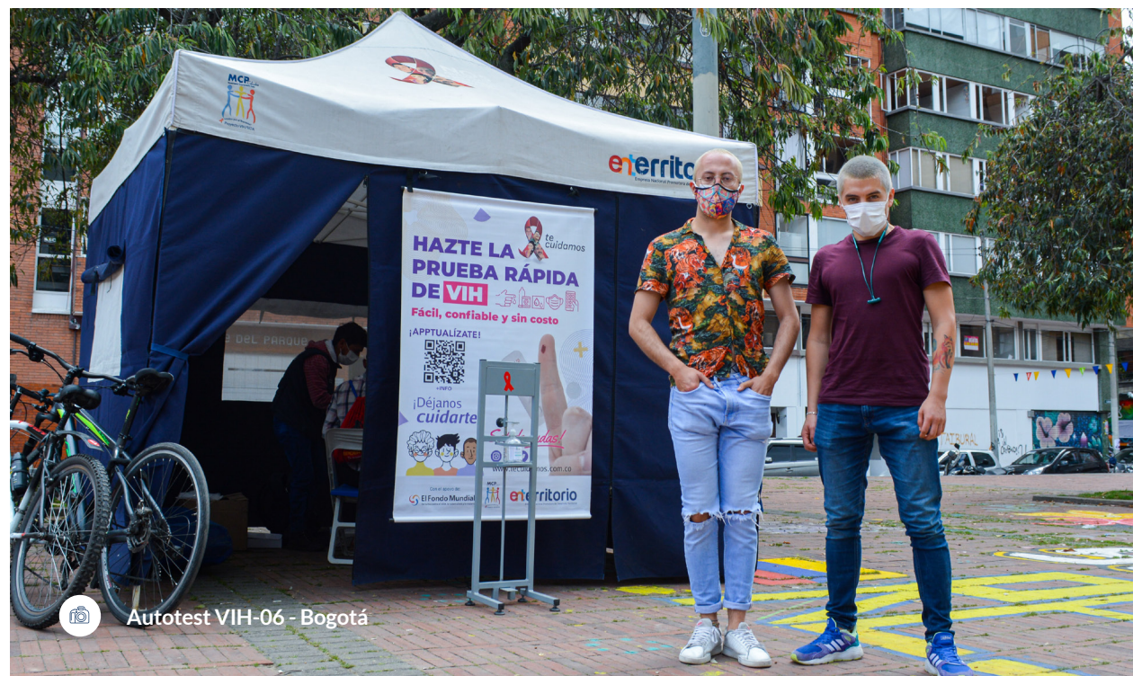
Autotest VIH-06 - Bogotá

Los buenos resultados obtenidos por ENTerritorio S.A. a lo largo de tres años, reportados periódicamente al Fondo Mundial, hacen que la empresa se haya consolidado como receptora del Fondo Mundial hasta el 31 de diciembre de 2025.