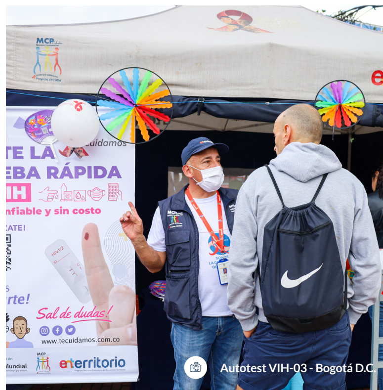
Autotest VIH-03 - Bogotá D.C.