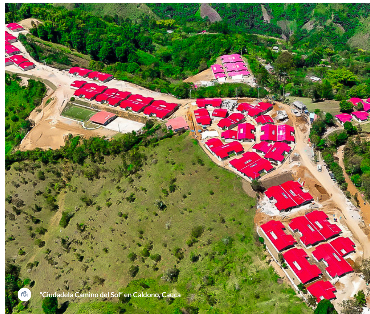
“Ciudadela Camino del Sol” en Caldono, Cauca

La transformación del antiguo ETCR Los Monos en la Ciudadela Camino del Sol refleja que la paz avanza desde los hogares, desde la construcción de un techo seguro y desde el fortalecimiento de las raíces territoriales. Familias que un día estuvieron inmersas en el conflicto hoy emplean sus manos para cultivar, criar, convivir y sostener la vida cotidiana en comunidad.