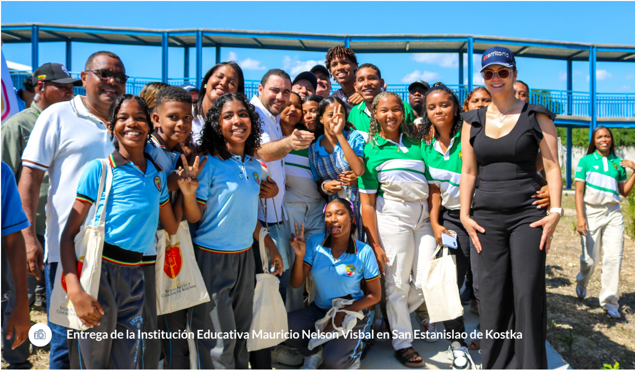
Entrega de la Institución Educativa Mauricio Nelson Visbal en San Estanislao de Kostka

En conjunto, estas iniciativas suman más de 12 proyectos específicos que reflejan la diversidad y complejidad del territorio colombiano. Desde la construcción de coliseos deportivos en Cundinamarca hasta la canalización de ríos en la Costa Caribe, los Pactos Territoriales son hoy una evidencia palpable de que la planificación participativa y la gestión técnica pueden transformar realidades.