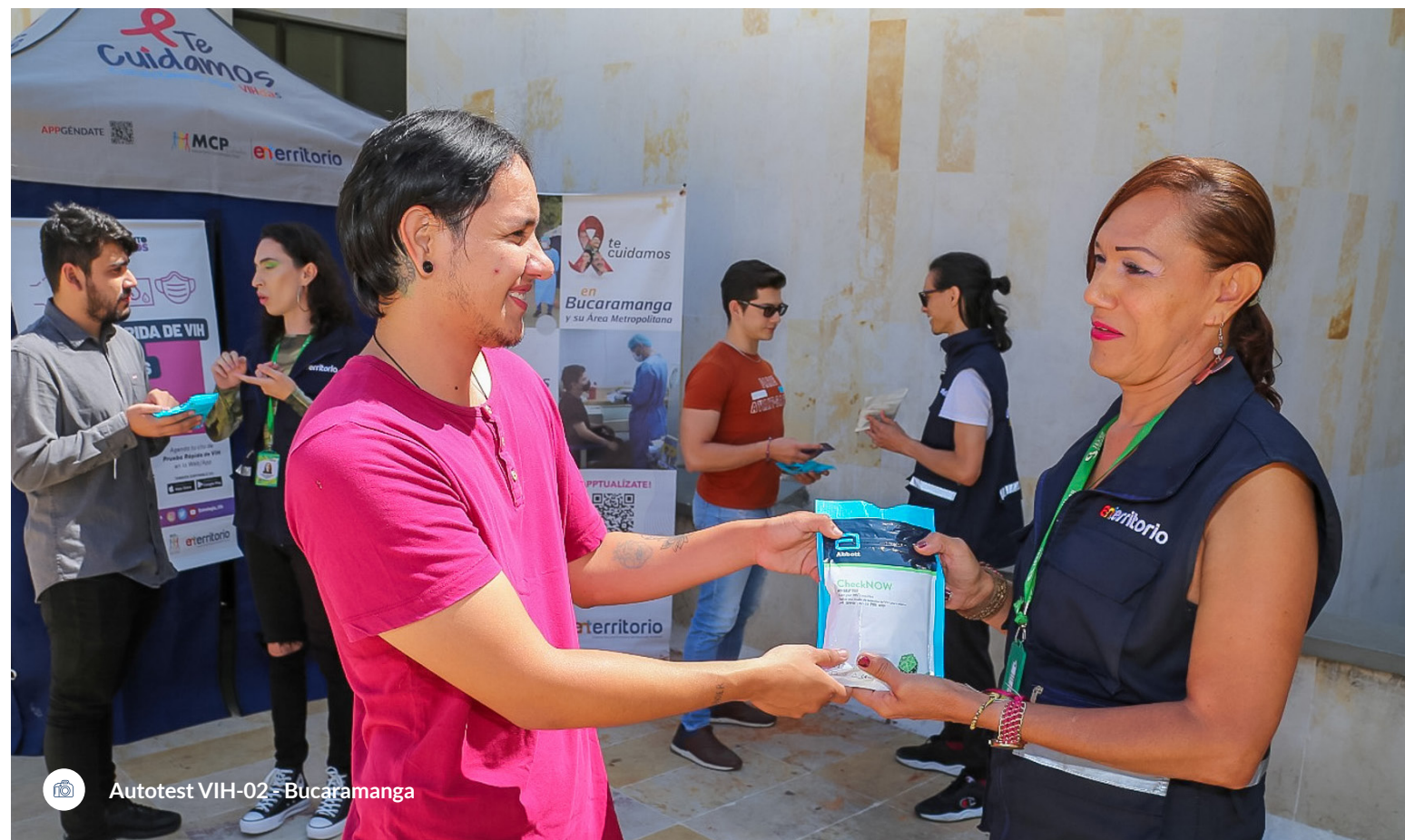
Autotest VIH-02 - Bucaramanga

Otro de los desafíos que trajo consigo la implementación del proyecto es el fortalecimiento del programa de atención integral para personas migrantes que viven con VIH, mediante la Red Especializada de Instituciones Prestadoras de Servicios de Salud en 14 ciudades de Colombia (población sujeto del programa: hombres y mujeres migrantes venezolanos con estatus irregular, mayores de 18 años con intención de permanencia en el país y confirmación diagnóstica de VIH en el programa de subvención del Fondo Mundial), con la identificación de retos para la adherencia al programa y la terapia antirretroviral por los usuarios, así como la continuidad de atención en casos clínicos con la presencia de comorbilidades, coinfecciones y complicaciones. Esta situación requirió la definición de rutas territoriales para garantizar el acceso de la población migrante a la atención de servicios complementarios, tales como: la atención del parto, hospitalización, procedimientos quirúrgicos, ayudas diagnósticas, manejo de coinfecciones como Tuberculosis, entre otros.