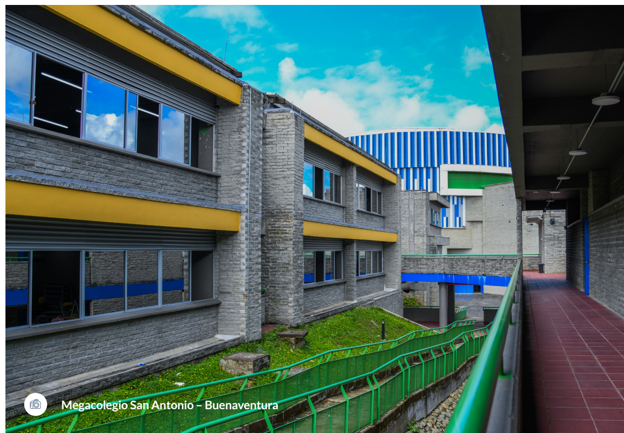
Megacolegio San Antonio – Buenaventura