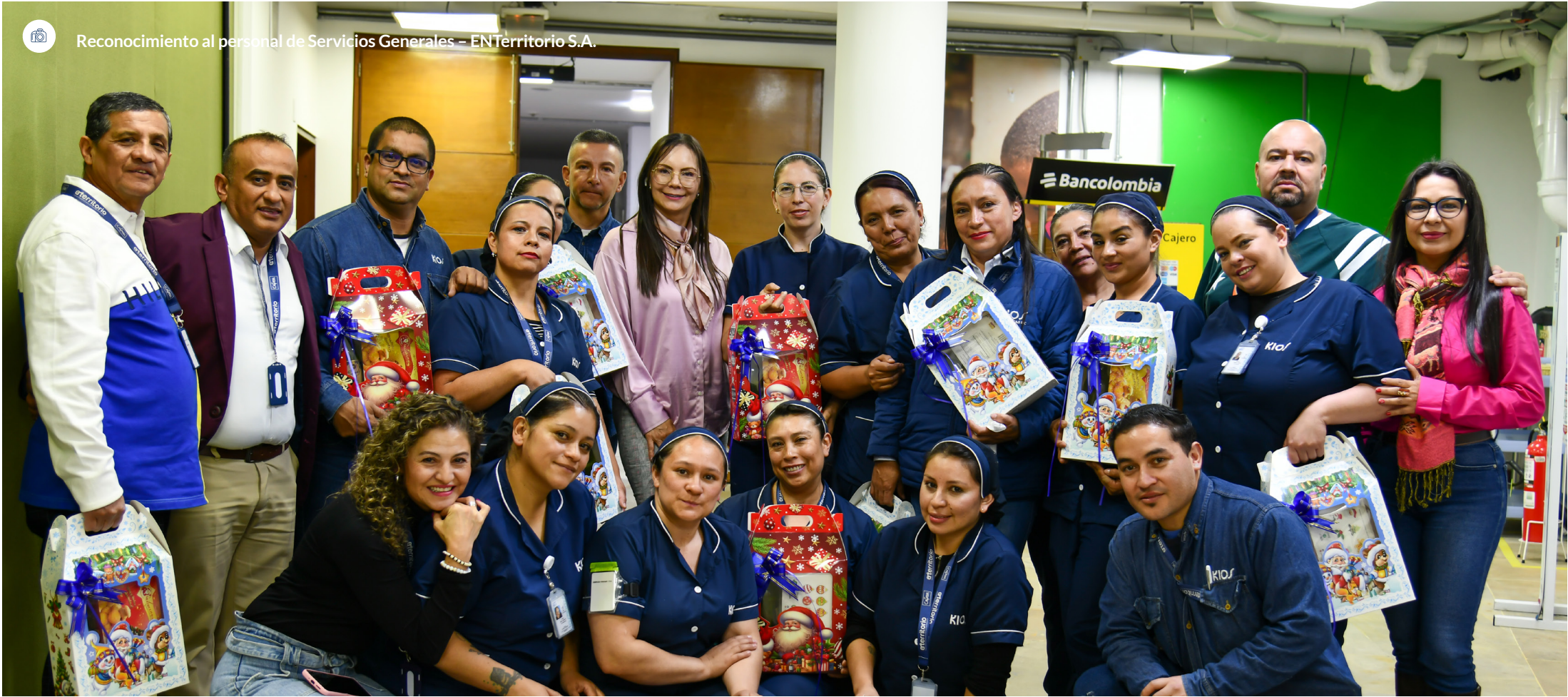
Reconocimiento al personal de Servicios Generales – ENTerritorio S.A.

Esta etapa reafirma que el bienestar es una responsabilidad compartida.