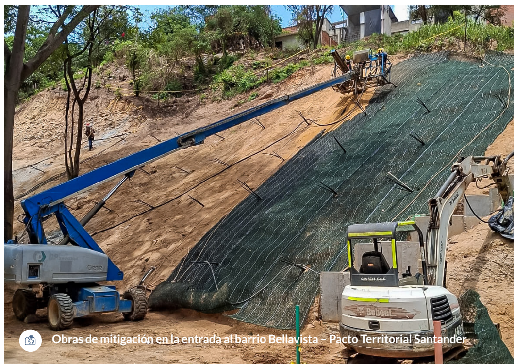
Obras de mitigación en la entrada al barrio Bellavista - Pacto Territorial Santander

en Salud, beneficiando a más de 390.000 personas y garantizando atención oportuna en comunidades indígenas y rurales dispersas.