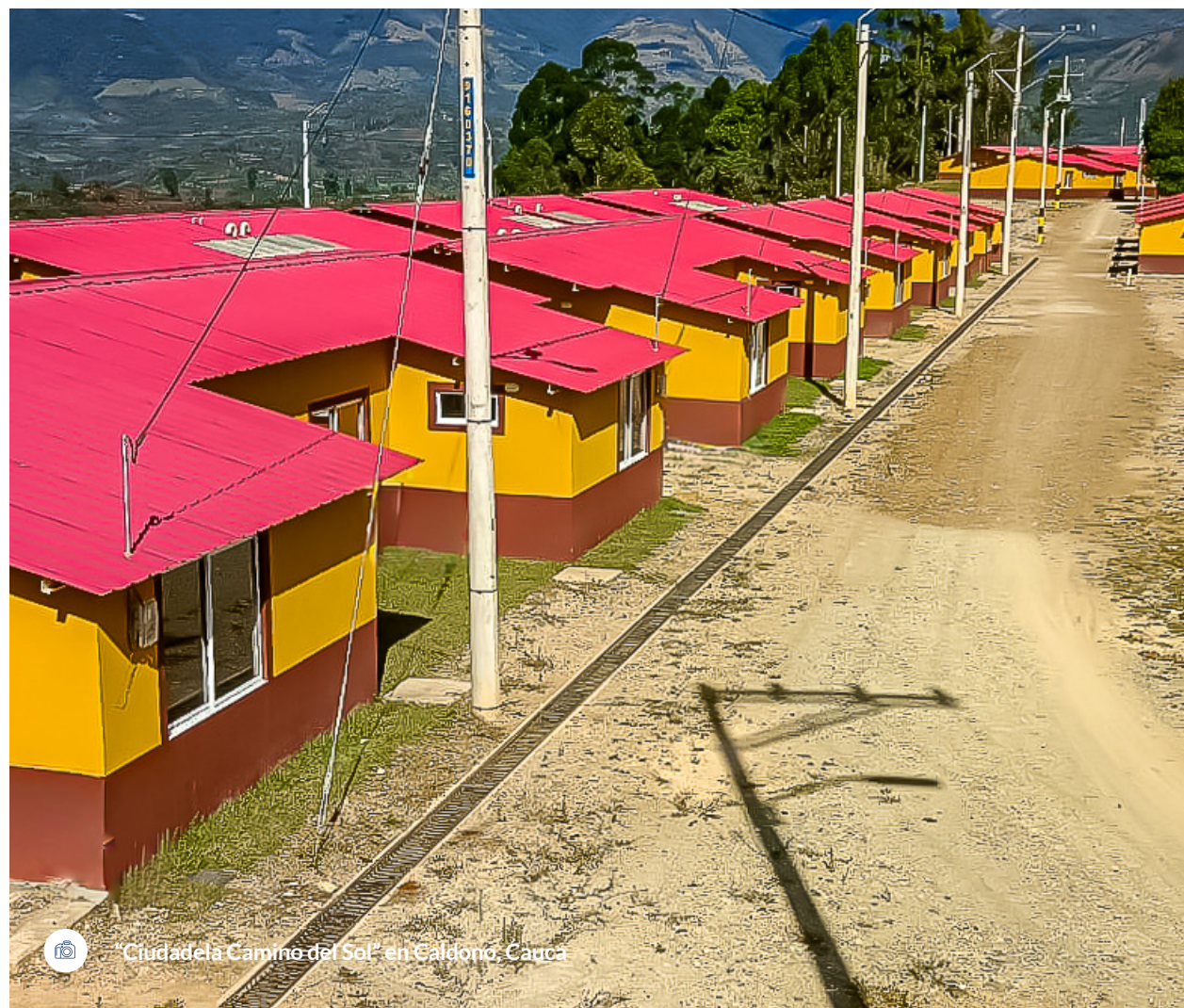
“Ciudadela Camino del Sol” en Caldono, Cauca

alcantarillado, energía eléctrica, vías internas y plantas de tratamiento de agua potable y residual.