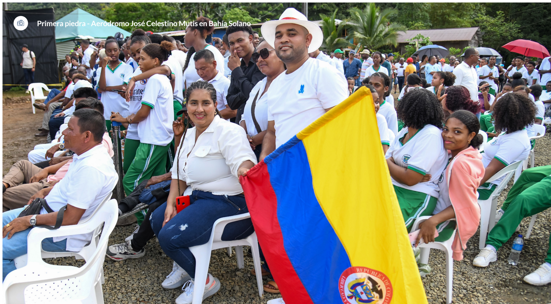
Primera piedra - Aeródromo José Celestino Mutis en Bahía Solano

De la misma manera en que trabajamos por el acceso a vivienda y servicios básicos, fortalecemos la infraestructura de salud en los territorios. Con el Ministerio de Salud y Protección Social, ejecutamos el proyecto CAPS La Guajira, que contempla la reposición de 26 Centros de Atención Primaria