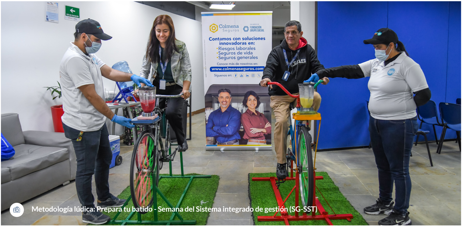
Metodología lúdica: Prepara tu batido - Semana del Sistema integrado de gestión (SG-SST)

No depende únicamente de un grupo, sino de toda la comunidad de ENTerritorio S.A. Cada colaborador, desde su rol, puede sumar y enriquecer este camino, fortaleciendo los lazos que nos unen y manteniendo viva la convicción de que juntos creamos un entorno más humano, inclusivo y sostenible.