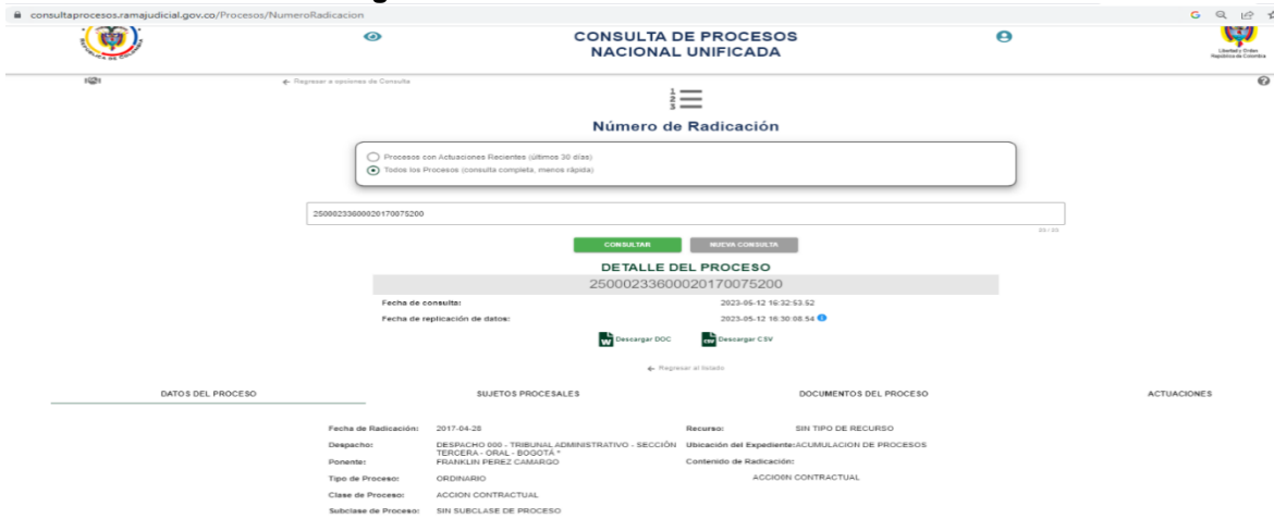
Imagen 4. Pantallazo Portal Web Rama Judicial