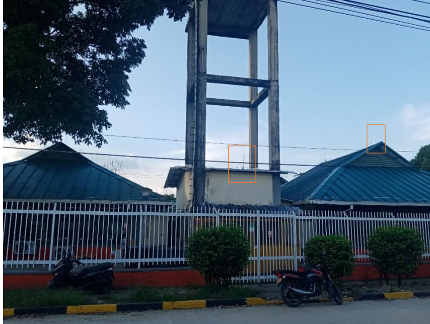
Fotografía 5. Vista general de puntas captadoras instaladas y estructura de tanque. En la fotografía se indica las puntas de captación y la estructura que sobresale del tanque.