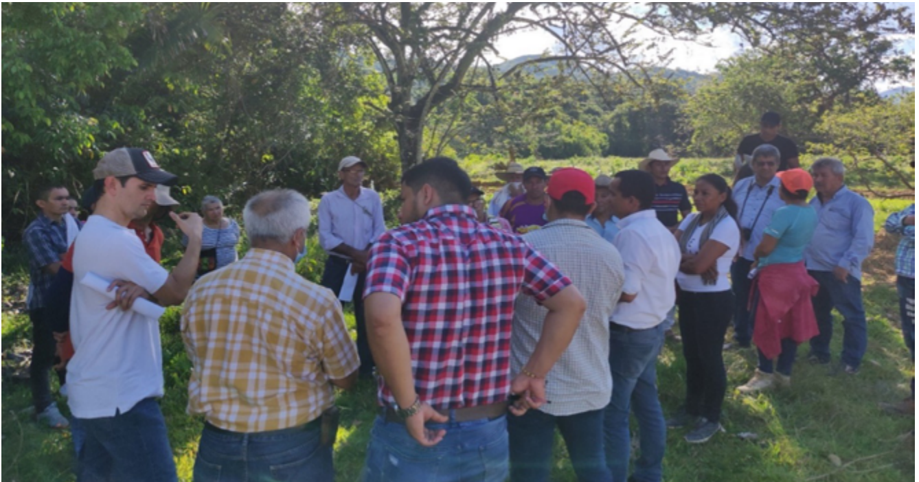
Foto: Presentación del proyecto con asistencia de la comunidad