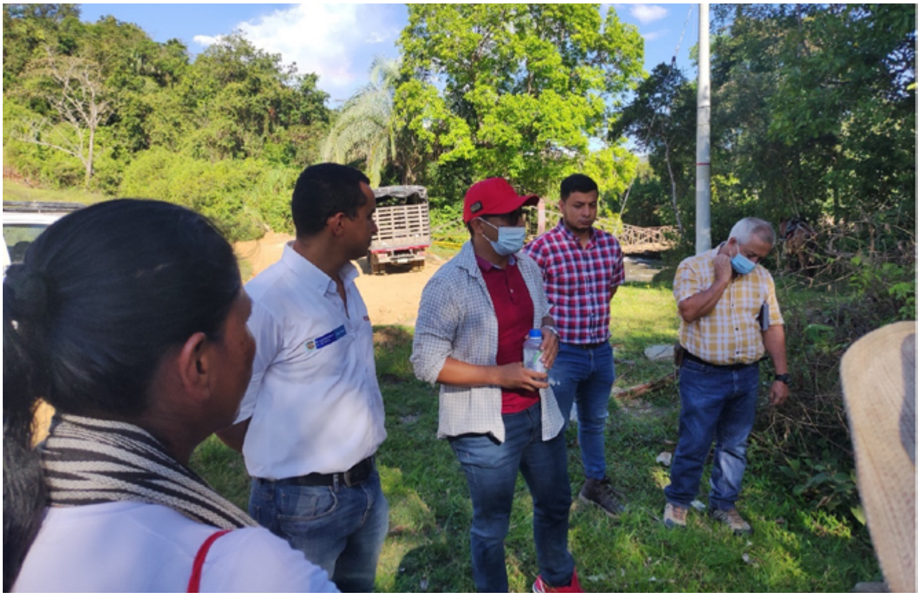
Foto: Presentación del proyecto con asistencia de la comunidad