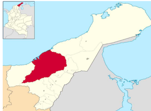
Figura 1: Localización municipio de Riohacha, La Guajira

CLÁUSULA QUINTA. LUGAR DE EJECUCIÓN: El lugar de ejecución del proyecto se localiza en la avenida primera en el Municipio de Riohacha Departamento de La Guajira.