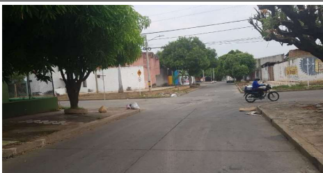
Descripción: Carrera 13 vista de norte a sur sobre la Calle 19B