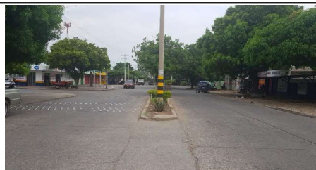
Descripción: Carrera 12 vista de norte hacia el sur