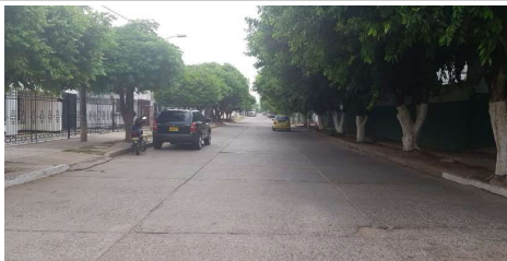
Descripción: Calle 19B sobre acceso al colegio vista sentido norte - sur