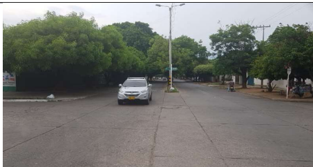
Descripción: Carrera 12 vista de sur hacia el norte