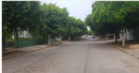
Descripción: Vista de sur a norte de la calle 19B desde acceso del colegio