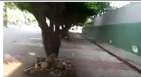
Descripción: Carrera 12 andén costado occidental sobre el colegio