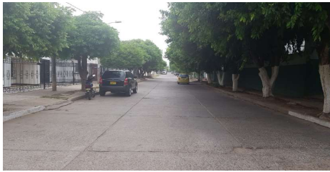
Descripción: Calle 19B sobre acceso al colegio vista sentido norte - sur