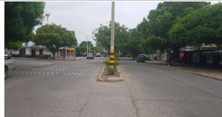
Descripción: Carrera 12 vista de norte hacia el sur