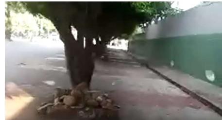
Descripción: Carrera 12 andén costado occidental sobre el colegio