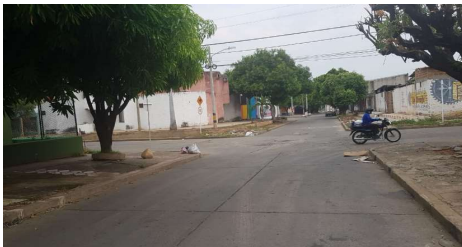
Descripción: Carrera 13 vista de norte a sur sobre la Calle 19B