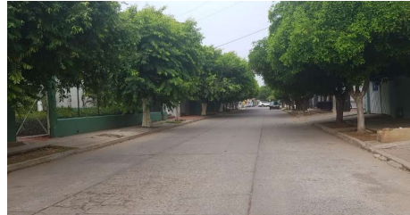
Descripción: Vista de sur a norte de la calle 19B desde acceso del colegio