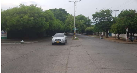
Descripción: Carrera 12 vista de sur hacia el norte