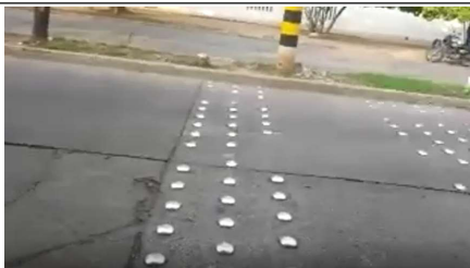
Descripción: Carrera 12, estoperoles metálicos en regular estado