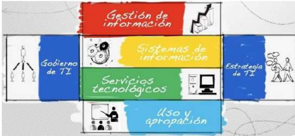
Imagen No.1 Componentes modelo de gestión IT4+

organización y mejorar la forma como se prestan los servicios misionales”. Contempla los aspectos a tener en cuenta en la gestión de TI, integrado y estructurado en 6 componentes estratégicos así: